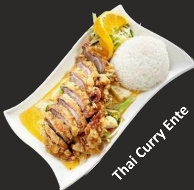
Thai Curry Ente