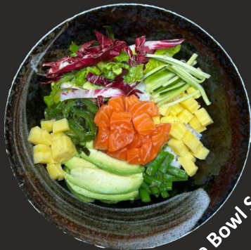
Poke Bowl Salmon