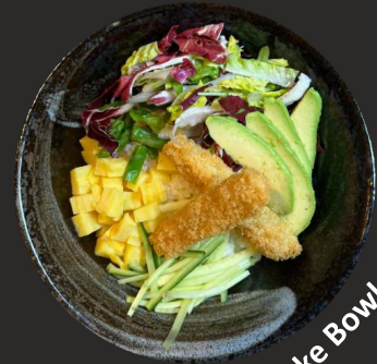
Poke Bowl Veggie