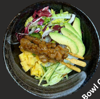
Poke Bowl Chicken