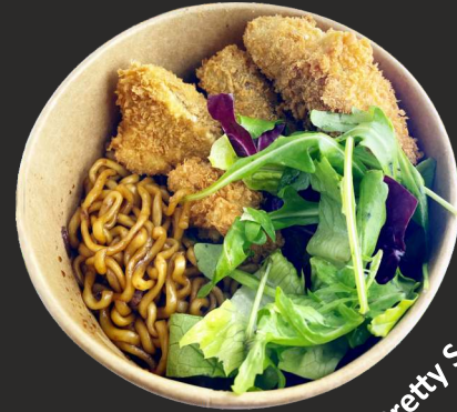
Pretty Spicy Chick