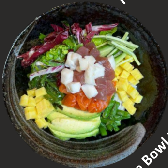
Poke Bowl Deluxe