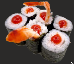
Spicy Ebi Maki