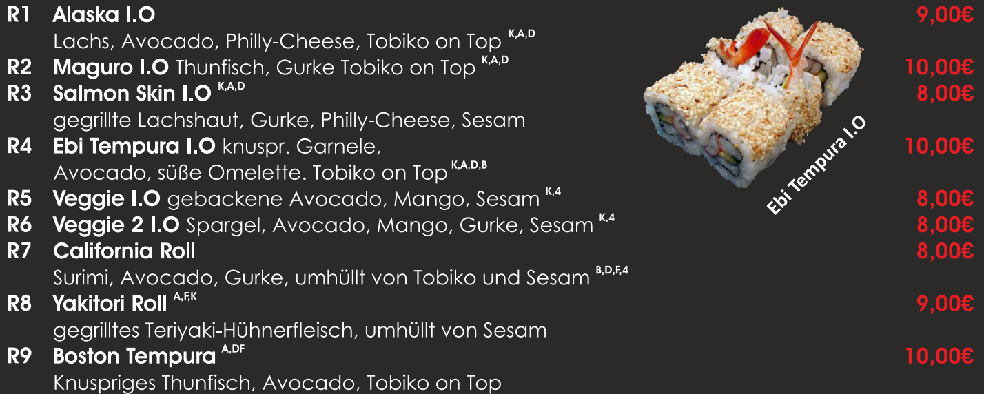
Ebi Tempura I.O