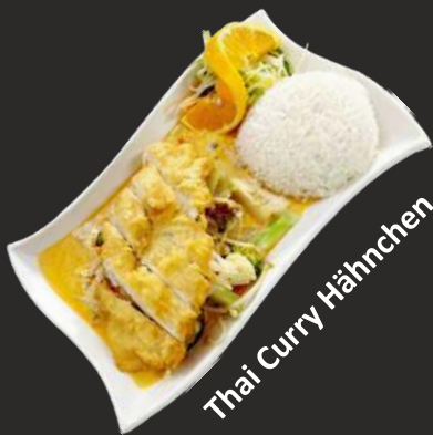
Thai Curry Hähnchen