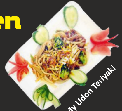
My Udon Teriyaki